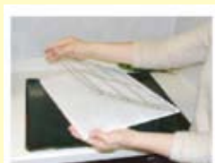
替えフィルターの交換