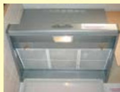
レンジフードへの取付