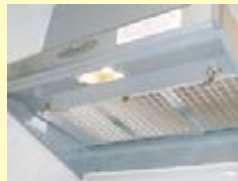
通常は金網が付いてます

オーダーサイズの 換気扇フィルター なので これからご入居される 住居の換気扇に ピッタリフィット。 お掃除もラクラク。 キッチンの 油污れ対策に…。