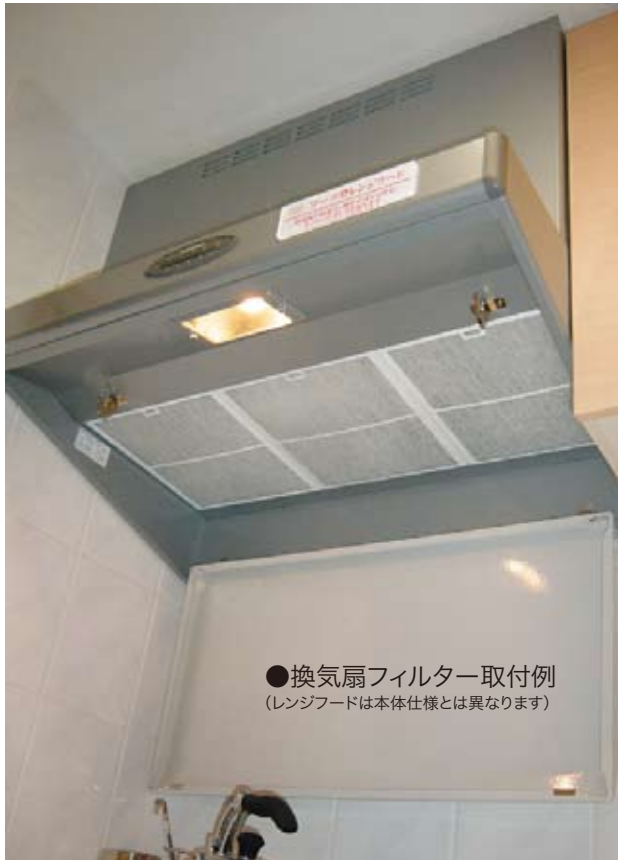
●換気扇フィルター取付例 (レンジフードは本体仕様とは異なります)